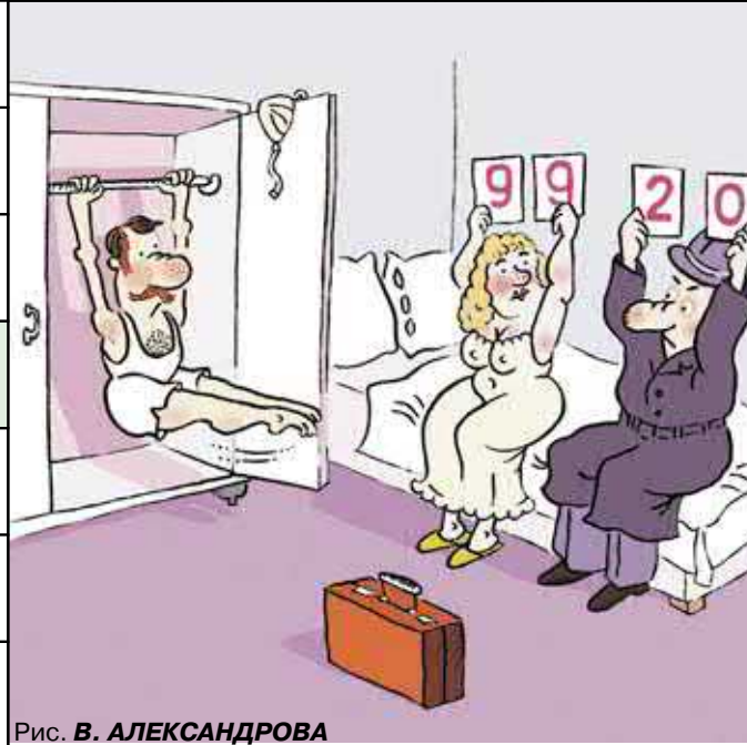
Рис. В. АЛЕКСАНДРОВА